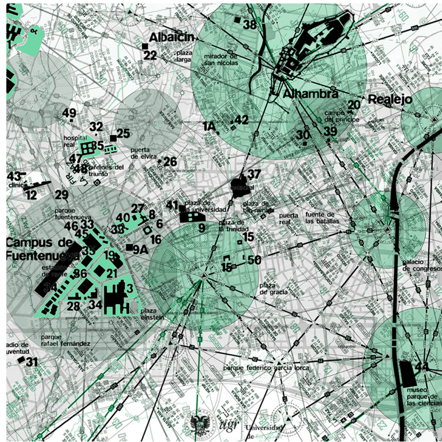
Granada. Piano per gli Spazi sociali di apprendimento / Granada. Social Spaces of Learning plane.

Come superare tale problema? Qual'è l'interfaccia possibile affinché questo sviluppo dei processi di apprendimento si produca anche in un senso fisico? La risposta sarà la città. Le dinamiche urbane possono apportare diverse possibilità di riflessione rispetto ai nuovi spazi e situazioni di apprendimento, forse, attraverso il contagio tra l'interno e l'esterno, assimilando l'uno dall'altro le caratteristiche che li arricchiscono.